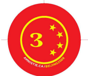
Médailles pour les Olympiades