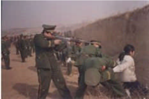
Peine de mort en Chine